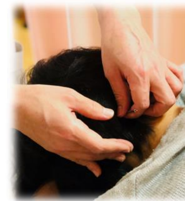
天柱(てんちゅう)の刺鍼 頭部の熱を取るために鍼を行います。頭痛、目眩、肩こり、睡眠障害、背腰部のこり等にも効果があります。

また、写真のように、直接頭部のツボを使い、目や鼻の周辺の熱を取る、背腰部やふくらはぎのツボを使い上半身に集中した熱を手足の末端に拡散する等の鍼灸を行ないます。