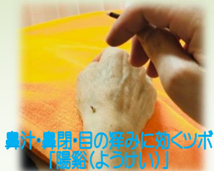
鼻汁・鼻閉・目の痒みに効くツボ「陽谿(ようけい)」