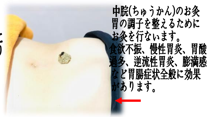
中脘(ちゅうかん)のお灸 胃の調子を整えるためにお灸を行ないます。食欲不振、慢性胃炎、胃酸過多、逆流性胃炎、膨満感など胃腸症状全般に効果があります。