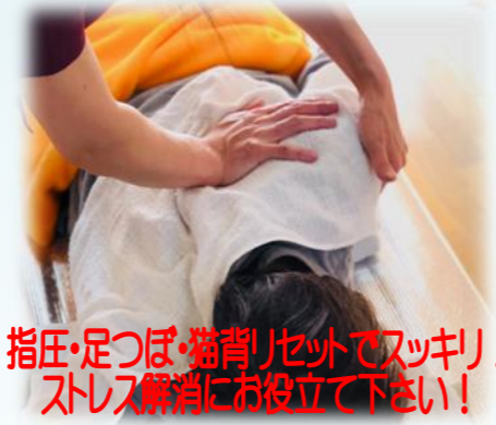
指圧・足つば・猫背リセットでスッキリ！ ストレス解消にお役立て下さい！